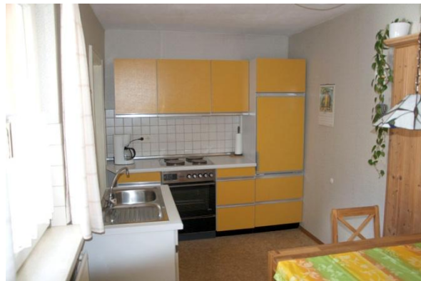
voll ausgestattete Küche