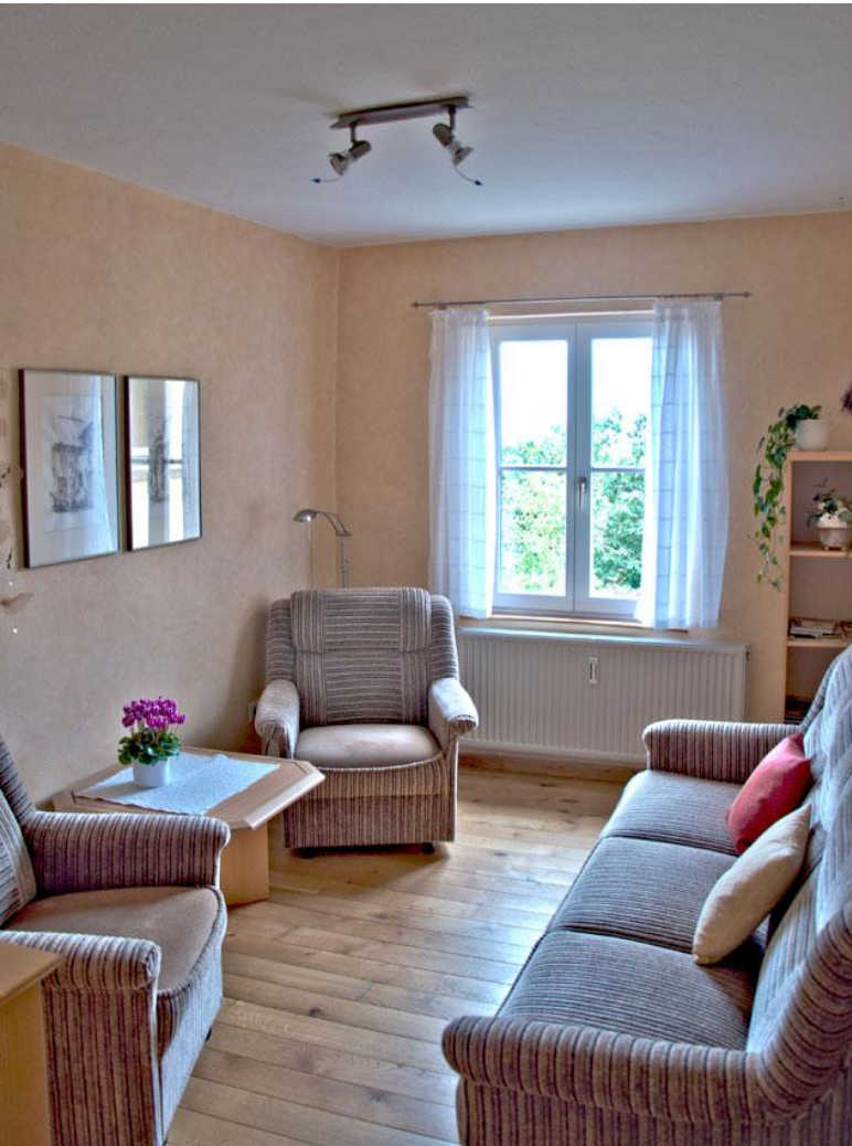
Wohnzimmer mit Auszieh-Couch