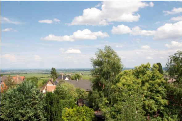
Ausblick in die Rheinebene