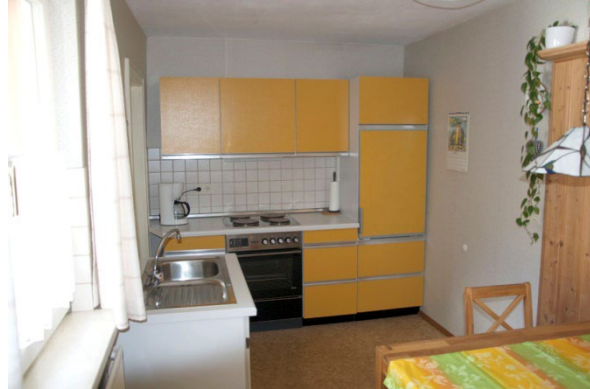
voll ausgestattete Küche