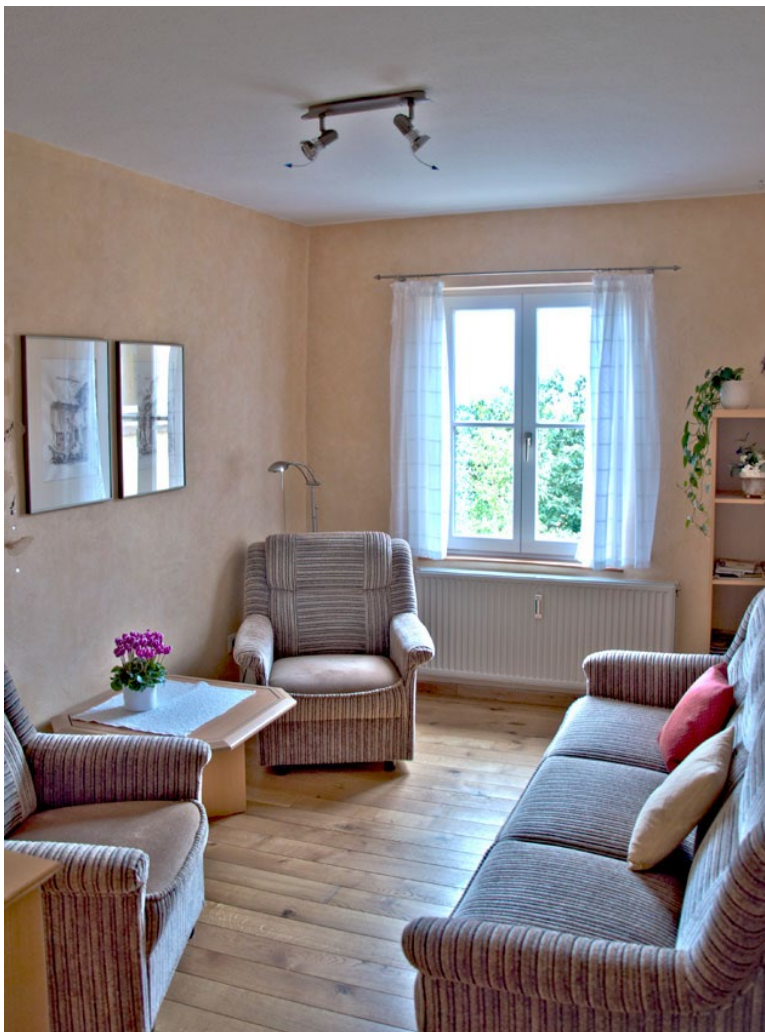
Wohnzimmer mit Auszieh-Couch