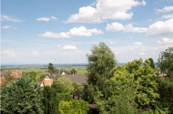
Ausblick in die Rheinebene