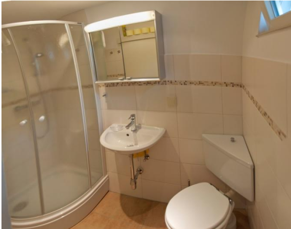
Das Badezimmer mit WC / Dusche